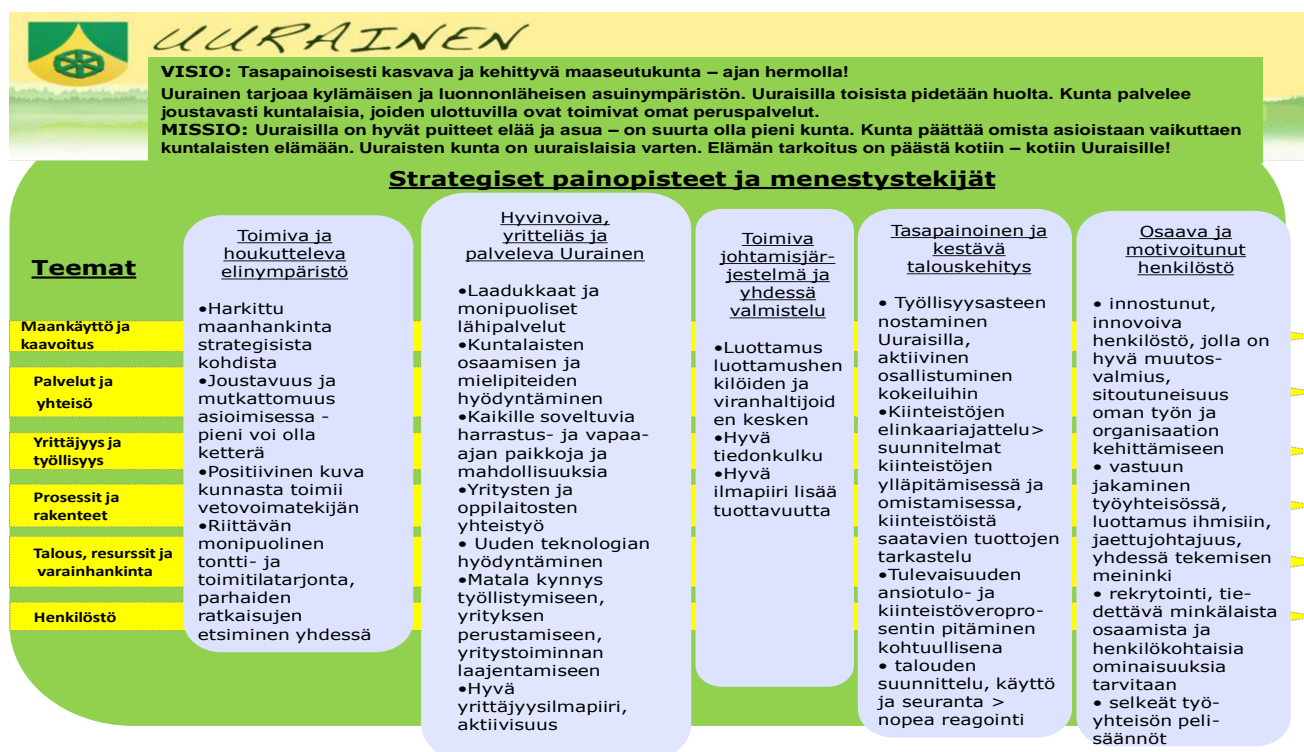
Kuva 1 ja 2. Uuraisten kunnan strategia ja siitä johdettu hankintastrategia

Uuraisten kuntakonsernin hankintaohjelma toteuttaa kunnan 2017 – 2022 strategian painopisteitä ja menestystekijöitä. Päämääriä toteutetaan ohjelmassa määritellyillä toimenpiteillä. Hankintaohjelman tavoitteet ovat hankintojen strategisuuden ja johtamisen vahvistuminen, hankintaprosessien ja toimintamallien systematisointi sekä hankintaosaamisen vahvistuminen.