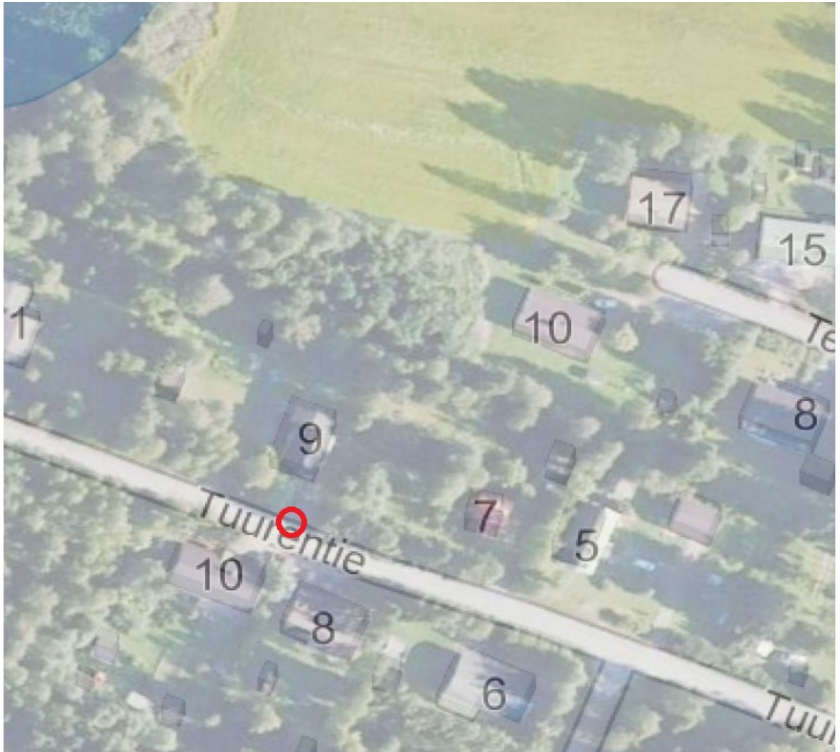
Oikotie, Leinikinpuisto, ajoportin ympäristö 3m2